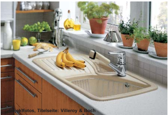
Objektfotos, Titelseite: Villeroy & Boch